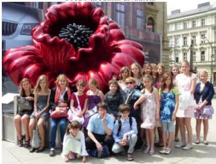
Před Národním divadlem